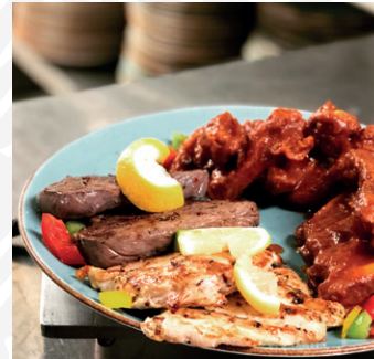
SPÉCIALITÉS DE GRILLADES